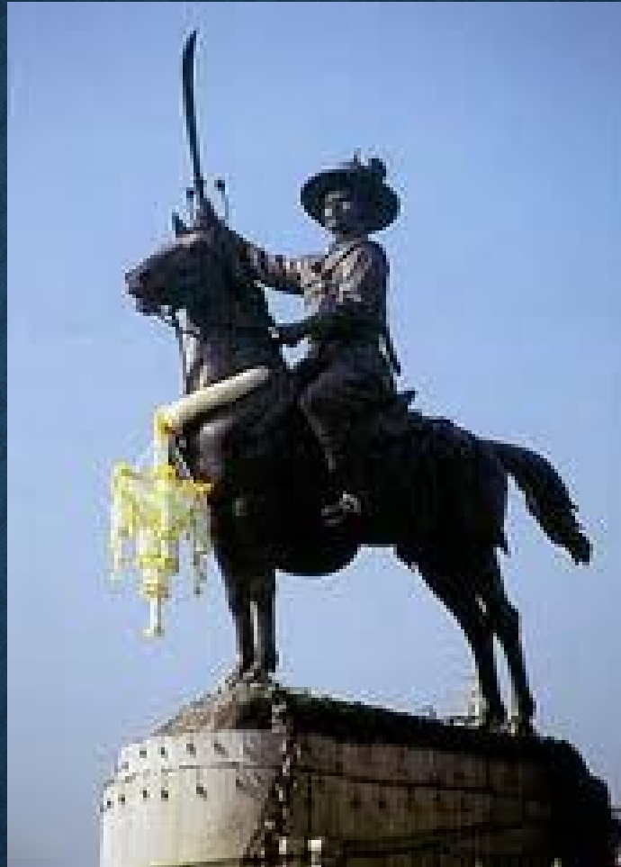
พระบาทสมเด็จพระเจ้าตากสินมหาราช