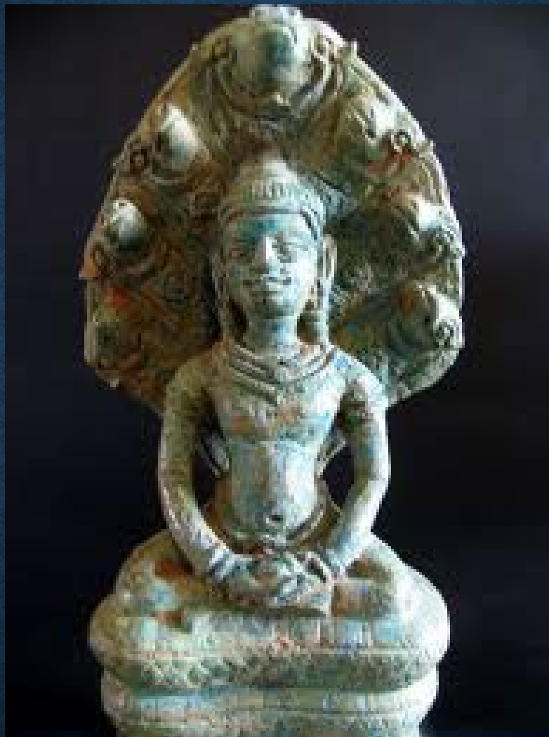
พระโกษัชยคุรุไวฑูรยประภา